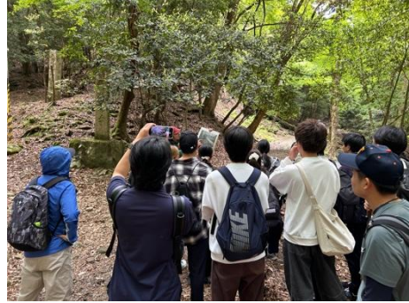
滝坂の道の過去との変化に気づく