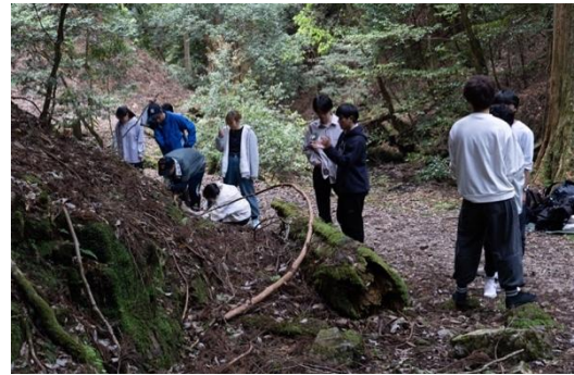
ルーペを使ってコケの観察